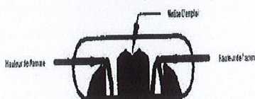
Brûleur vu par la fente de la cheminée